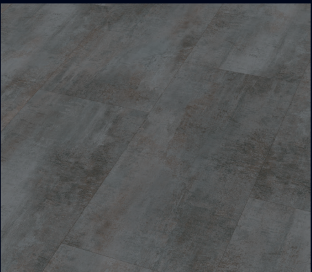
Copper Iron 6857 | Decor