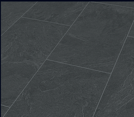
Leisteen antraciet 6137 | Imitatie