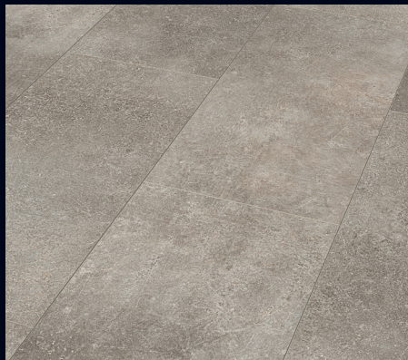
Cool Storm 6533 | Decor