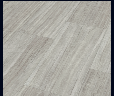
Layer Stone 6860 | Decor