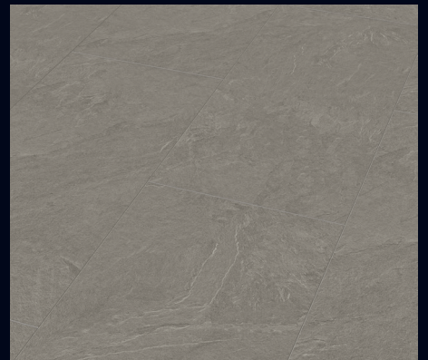
Leisteen grijs 6136 | Imitatie