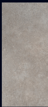
LB 150 vanaf pagina 66 853 x 395 x 8 mm