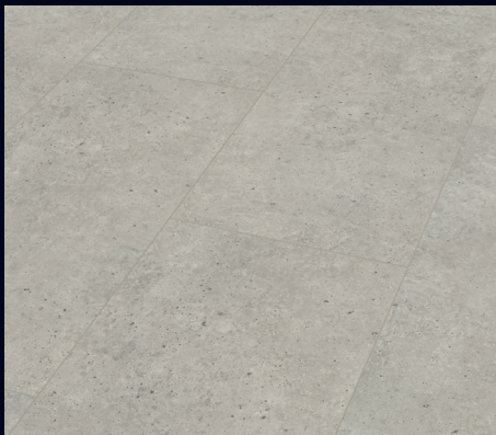
Beton 7321 | Imitatie